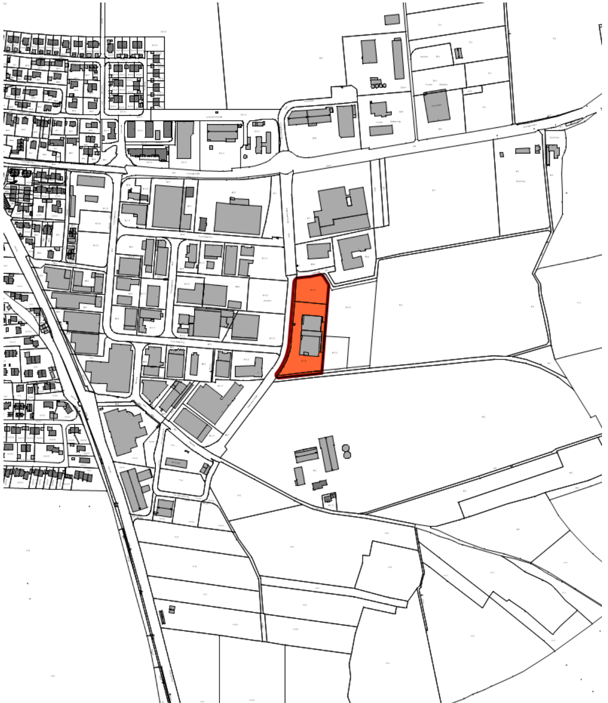
Lageplan M 1:5.000.